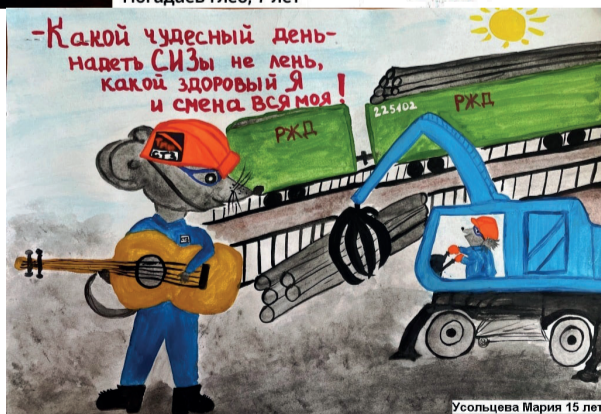
Усольцева Мария 15 лет

данный момент, несовершенства системы управления охраной труда и т.п. По выявленным нарушениям будут применяться меры прокурорского реагирования! Кроме того, не решен вопрос финансирования мероприятий по охране труда, особенно в учреждениях сферы социального обслуживания населения.